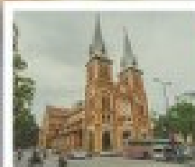
โบสถ์ มดกทงเดม