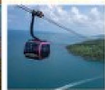
กระเช้าเหิน