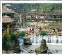
หมู่บ้าน ถ้ำ ถัด