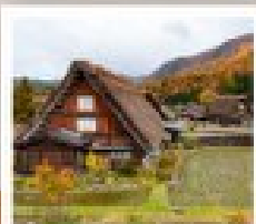
ชิราคาวาโกะ