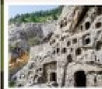
กำแพงหลงเหมิน