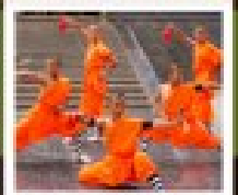
โชว์ราชวงศ์ถัง

PERIOD 1 : 9 - 14 สิงหาคม | PERIOD 2 : 18 - 23 ตุลาคม 2567