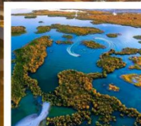
ทะเลสาบอูลุนกุ

ผ่านทางด่วนทะเลทราย S21 / ทะเลสาบอูลุนกุ / ปู่อ๋อจิน / เซาโปซา / ทุ่งหญ้าอาเหอถังโก่ตี้ / หมู่บ้านเหม่อู่ซุน / คานาสีอ / ทะเลสาบมังกรหลับ / ทะเลสาบเทวดา จุดชมวิวกานาสีอ / ศาลาชมปลา / ค่องเรือทะเลสาบคานาสีอ / หาดห้าสี / เมืองปีศาจ / เมืองคาลามาอี / คาลามาอี / แกรนด์แคนยอนตูซันจือ / ตลาดต้าปาจา