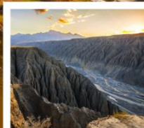
แกรนด์แคนยอนตูซันจือ