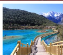
ปู้สูยเหอ