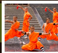
โชว์เส้าหลิน

PERIOD 1 : 9 - 14 สิงหาคม | PERIOD 2 : 18 - 23 ตุลาคม 2567