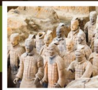
สุสานจีนซี

วัดเส้าหลิน / ป่าเจดีย์ / โชว์การแสดงวิทยายุทธเส้าหลิน / อุทยานหยุนโกซาน ศาลเจ้ากวนอู / ถ้ำหินหลงเหมิน / สุสานทหารจีนซี / ถนนคนเดินวัฒนธรรมต้าถิง โชว์ราชวงศ์ถัง / กำแพงเมืองโบราณซีอาน / วัดลามะ / ตลาดมุสลิม