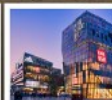
ย่านชานหฺลี่ตุ๋น