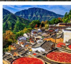
หมู่บ้านหวงหลิ่ง