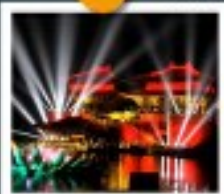
สวนชิงหมิงช่างเหอหยวน