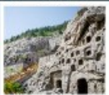
ถ้ำหินหลงหมิน