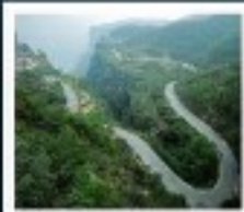
ไท่หิงซาน

หอสูนฉิว / ห้างสรรพสินค้าฟ้างตงหลาย เมืองไคเปิง / สวนชิงหมิงช่างเหอหยวน โชว์ราชวงศ์ซ่ง / แกรนด์แคนยอนไท่หิงซาน หมู่บ้านถั่วเสียงซุม / 301ลำหัด ถ้ำหินหลงหมิน / เมืองโบราณทิวอี้ โชว์การแสดงวิทยาศาสตร์ล้ำสมัย