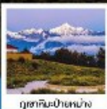
ภูเขาหิมะไป๋หม่าง