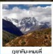
ภูเขาหิมะหม่าป๋อตี้