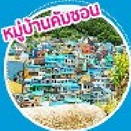
หมู่บ้านคัมซอน