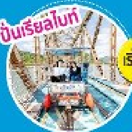
ปั่นเรือลโบท