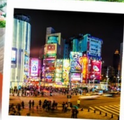
ตลาดซีเหมินติง