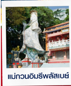
แม่กวณอิรม์พลัสเบย์