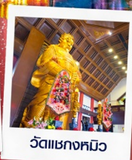
วัดเขกงหมิว