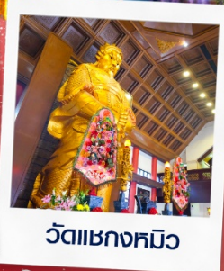
วัดแซกกงหมีว