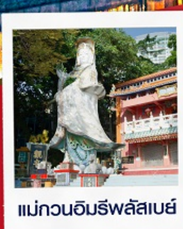
แม่กวนอิมรัฟลัสเบย์