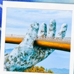
บาน่าฮิลล์