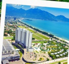
Mikazuki Japanese Resorts & Spa