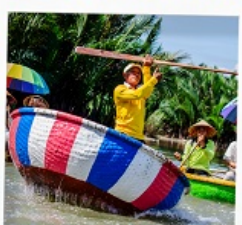
เรือกระดัง