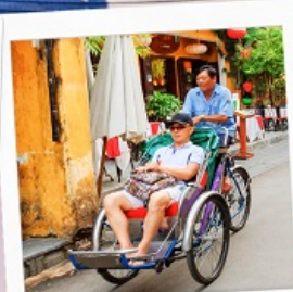
รถสามล้อ Cyclo