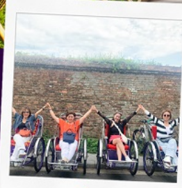
รถสามล้อ Cyclo