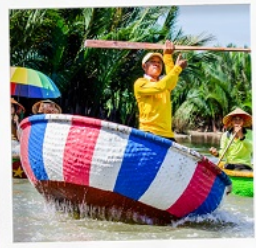
เรือกระดัง