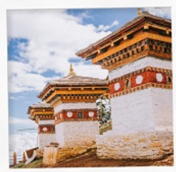
จุดชมวิวดาซูล่า