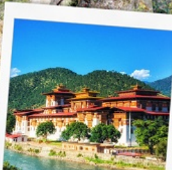
พูนาคาซอง