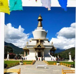
อนุสรณ์สถานทิมพู