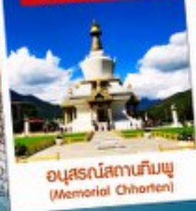
อนุสรณ์สถานทิมพู (Memorial Chhorten)

2 คน พร้อมออกเดินทาง! รวมค่าวีซ่า และ กาสิโนท้องถิ่นแล้ว