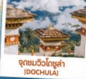
จุดชมวิวดอจุลา (DOCHULA)