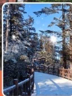
ภูเขาหว่าอูซาน