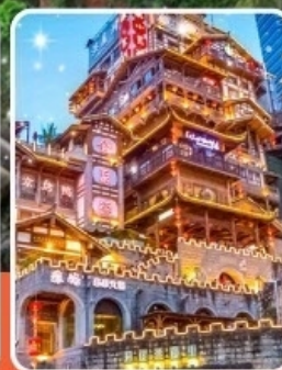
หงหยาดัง