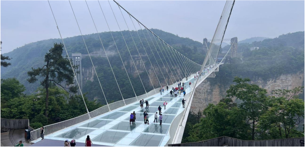
อัตราค่าบริการสำหรับโปรแกรมค่าบริการนี้รวมค่าบัตรเข้าชม ค่ายรถรับ - ส่ง และค่านำเที่ยวของไกด์ท้องถิ่น

ค่า บริการอาหารค่ำ ณ ภัตตาคาร ที่พัก MEI LUO SHUI JING HOTEL หรือ เทียบเท่าระดับ 4 ดาว, จางเจียเจีย