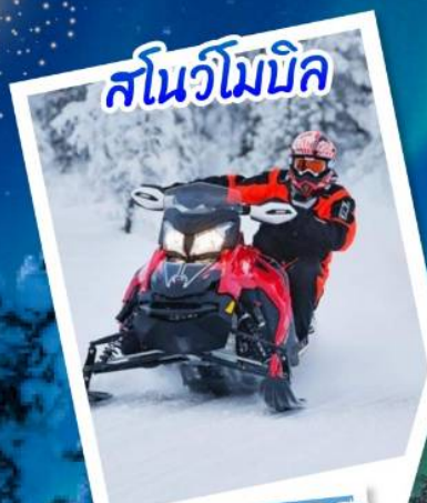
สโนว์โมบิล