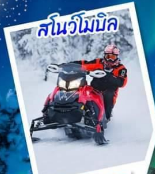
หมู่บ้านซานตาคลอส