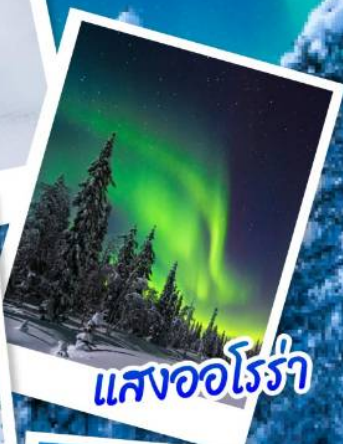
แสงออโรรา