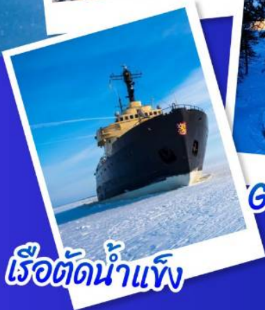
เรือตัดน้ำแข็ง