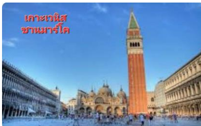
เกาะเวนิส ซานมาร์โค

นำท่านเดินทางสู่ ท่าเรือ เพื่อล่องเรือสู่ เกาะเวนิส จากนั้น เป็นการเดินเที่ยวชมย่านเมืองเก่าที่เรียกว่า จัตุรัสซานมาโค ให้ท่านได้ถ่ายรูปกับสถานที่สำคัญ อนุสาวรีย์วิกเตอร์เอมมานูเอล(บิคาแห่งอิตาลี), สะพานถอยหายใจ, มหาวิหารเซ็นต์มาร์ค, จัตุรัสซานมาโค และซื้อปิ้งสินค้าแบรนด์เนม หรือ จะนั่ง จิบกาแฟพร้อมฟังดนตรีแจ๊สตามอัชฌาศัย ( ท่านใดต้องการนั่งเรือกอน โดล่า กรุณาแจ้งหัวหน้าทัวร์ ล่วงหน้า ค่าเรือท่านละ 20 ยูโร นั่งได้ 6 ท่าน )