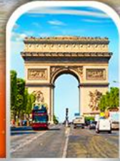
ARC DE TRIOMPHE FRANCE