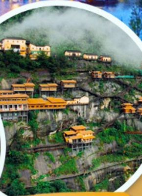
หุบเขาเทวดา