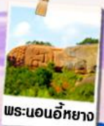
พระนอนอียาง