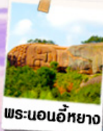
พระนอนอภัย