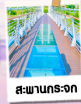
สะพานกระจก