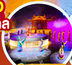
ชมโชว์อสังการ