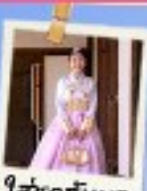
ใส่ชุดฮันบก