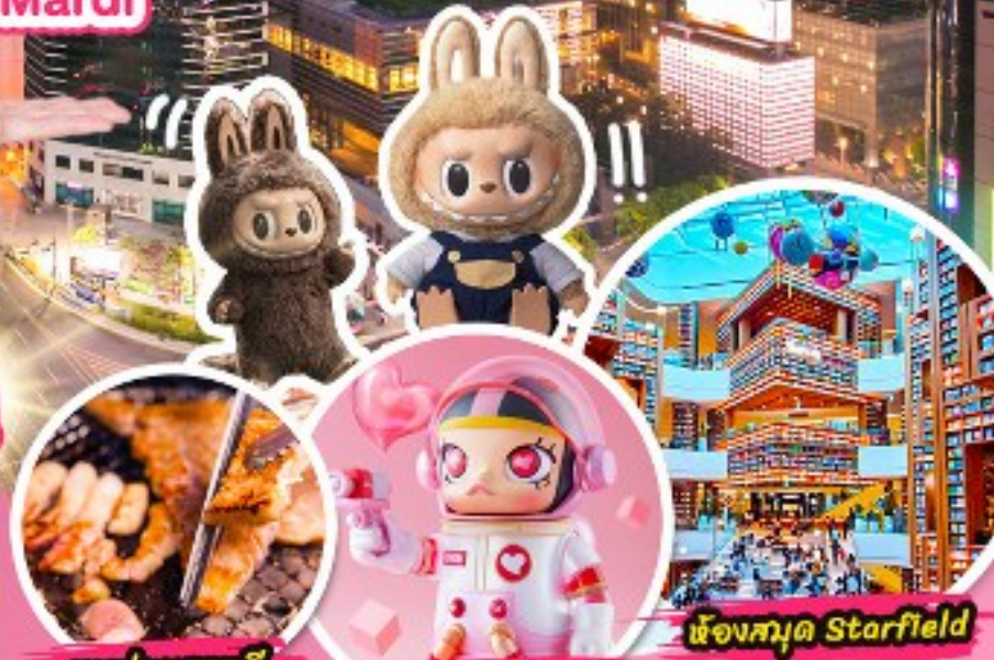
หมูย่างเกาหลี