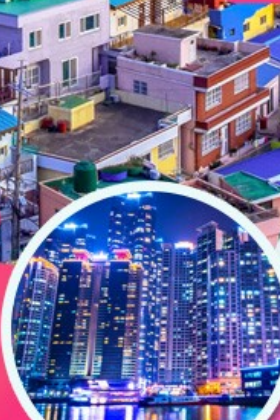
The Bay 101