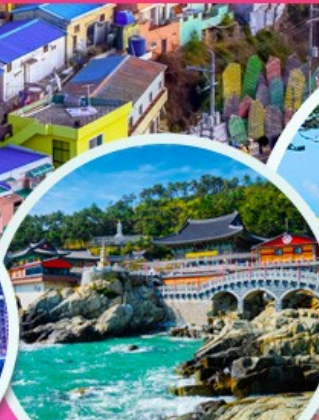
วัดแฮดง ยงกุงซา