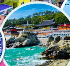
วัดแฮดง ยังกุงซา