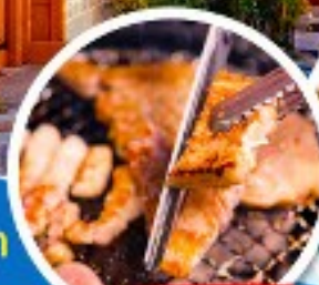
หมู่บ้านเกาหลี