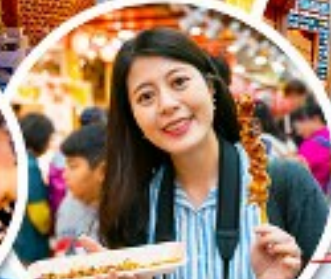
ตลาดควางจง