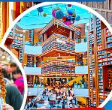
ห้องสมุด Starfield