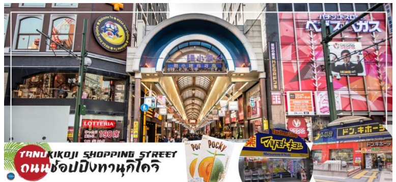
TANUKIKOJI SHOPPING STREET ถนนช้อปปิ้งทานุกิโจจิ

จากนั้นนำท่านสู่ ถนนช้อปปิ้งทานุกิโจจิ (Tanukikoji Shopping Street) เป็นย่านการค้าเก่าแก่ของเมืองซัปโปโร โดยมีพื้นที่ทั้งหมด 7 บล็อก ภายในนอกจากจะเป็นแหล่ง รวมร้านค้าต่างๆ อย่างร้านขายกิโมโน เครื่องดนตรี วิดีโอ โรงภาพยนตร์ แล้ว ยังมีร้านอาหารมากมาย ทั้งยังเป็นศูนย์รวมของเหล่าวัยรุ่น ด้วย เนื่องจากมีเกมเซินเตอร์ และตู้หยอดตุ๊กตามากมาย ร้านดองกิ ร้าน 100 เยน นอกจากนี้ที่นี่ยังมีการตกแต่งบนหลังคาด้วยตุ๊กตาทานุกิขนาดใหญ่ และเนื่องจากร้านค้าส่วนใหญ่มีหลังคาคลุม ดังนั้น ไม่ต้องกังวลเรื่อง ฝนหรือหิมะ ท่านสามารถช้อปปิ้งได้อย่างเพลิดเพลิน