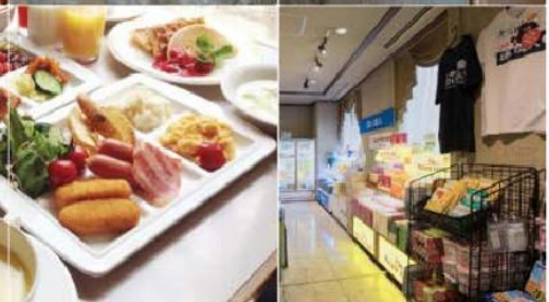
Hotel Crescent Asahikawa