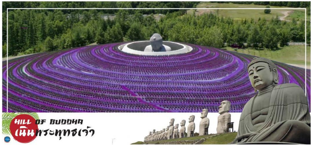
HILL OF BUDDHA เนินพระพุทธรเจ้า

01.20 น. ออกเดินทางสู่ ท่าอากาศยานนิวซีโดสะ เกาะฮอกไกโด ณ ประเทศญี่ปุ่น เที่ยวบินที่ XJ620