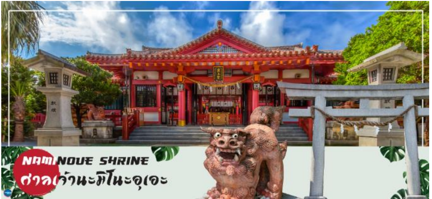
NAMINOUE SHRINE ศาลเจ้านะมิโนะอุเอะ

ศาลเจ้านามิโนะอุเอะ – อาชิบิโนะ เอาท์เล็ตมอลล์ – ท่าอากาศยานนาฮะ โอกินาวะ – ท่าอากาศยานดอนเมือง กรุงเทพฯ