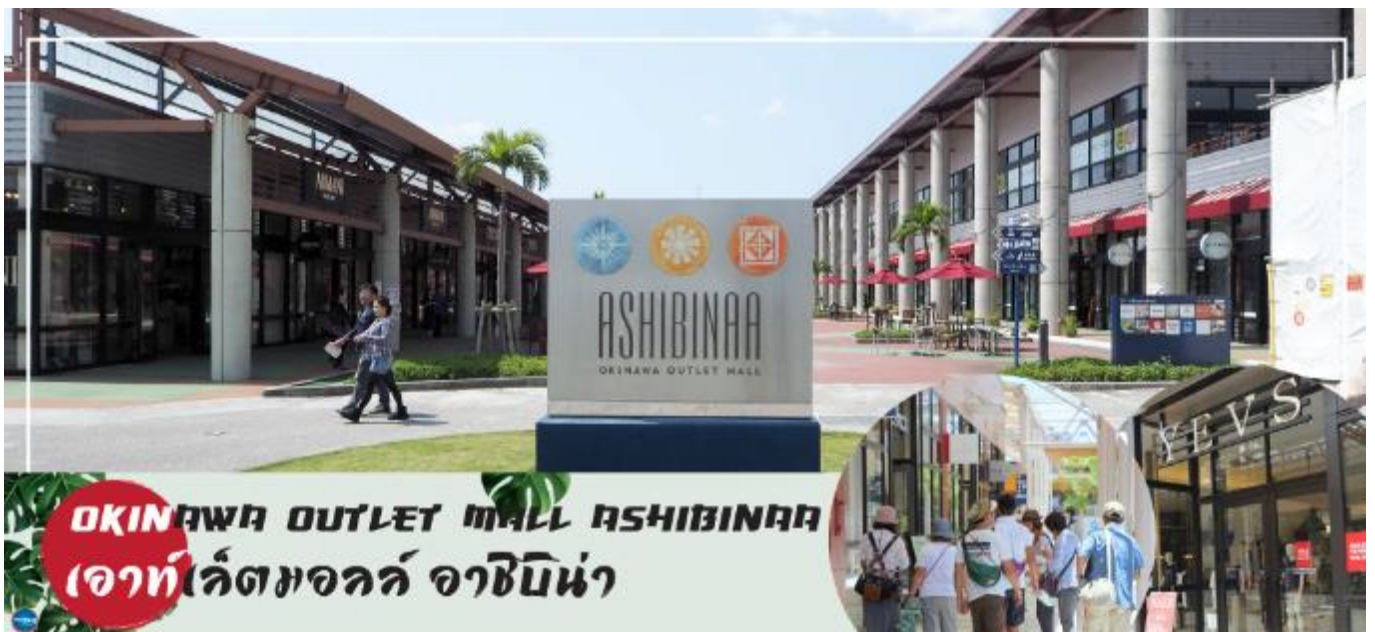
OKINAWA OUTLET MALL ASHIBINAA เอาท์เล็ตมอลล์ อาชิบิโนะ

(ใช้เวลาเดินทางประมาณ 30 นาที) เอาท์เล็ตแห่งแรกในโอกินาวะ รวบรวมร้านค้าชั้นนำกว่า 100 ร้าน ทั้งเสื้อผ้าแฟชั่น สินค้าแบรนด์เนม นาฬิกา ข้าวของเครื่องใช้ ของเล่น ทุกร้านจัดเต็มทั้งสินค้านำเข้าและรุ่นใหม่ ลดราคากระหน่ำกว่า 30-80% ให้ได้เดินช้อปปิ้งท่ายทริปกันอย่างจุใจ ภายใต้บรรยากาศสบายๆ สไตล์รีสอร์ทริมทะเล หากช้อปปิ้งเหนื่อยสามารถขึ้นไปทานอาหารที่ชั้น 2 มีอีกหลายร้านที่คอยให้บริการ