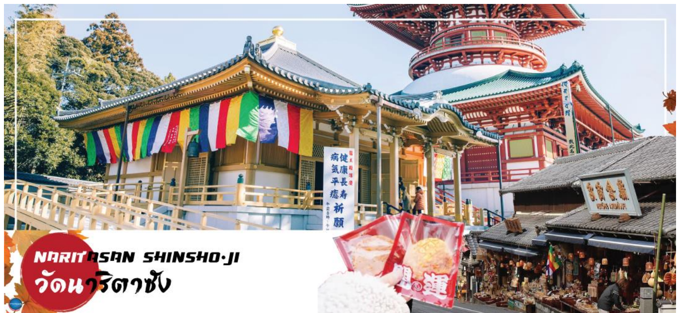
NARITASAN SHINSHO-JI วัดนาริตาซัง

วันที่สอง ท่าอากาศยานนานาชาตินาริตะ - วัดนาริตะชั้น - ถนนปลาไหล โอโมเตะซังโตะ - จังหวัดยามานาชิ - หมู่บ้านโอชิโนะสัคโค - ออนเซ็น + ขาปุยักษ์