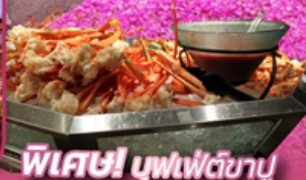
พิเศษ! นูฟเฟ็ตชิยาปู