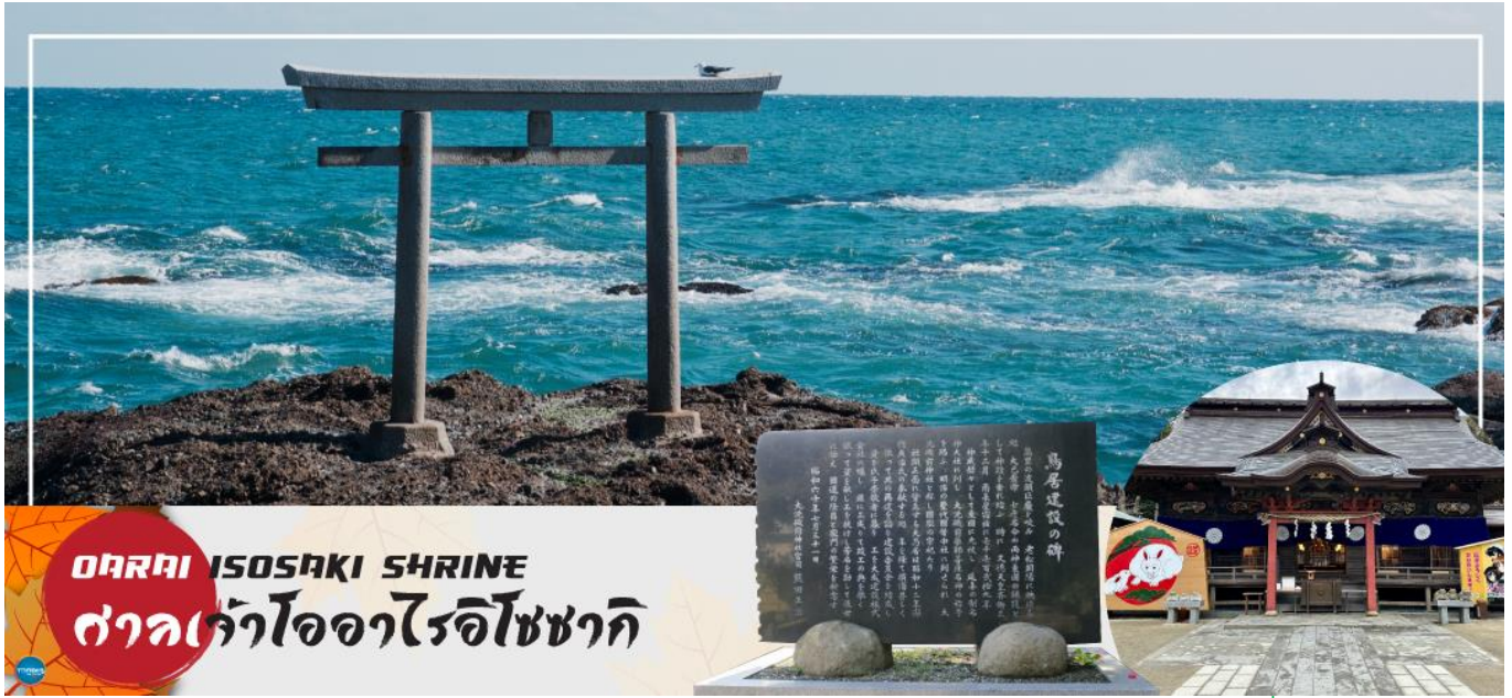
ONOMI ISOSAKI SHRINE ศาลเจ้าโออิวาไรโซซากิ

ของเทพเจ้าโอนามิจิโนะมิโคโตะ และ เทพเจ้าสุคะฮิโคะโนะมิโคโตะ สร้างขึ้นตั้งแต่ 29 ธันวาคม ค.ศ.856 รวมทั้งยังเป็นจุดถ่ายรูปพระอาทิตย์ขึ้นที่มีชื่อเสียง มีนักท่องเที่ยวมากมายมาเฝ้าคอยเพื่อเก็บภาพช่วงเวลาแสงตะวันสาดส่องขึ้นสู่ขอบฟ้า