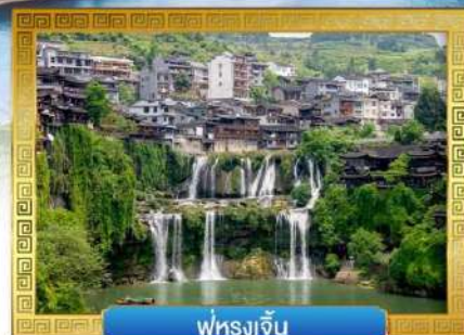
ฟูหลงเจิ้น