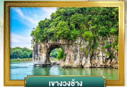
เขาวงวงช้าง