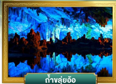
ถ้ำสุ่ยอ้อ