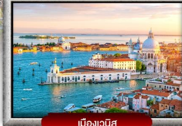
เมืองเวนิส

📍 ซอปปิง 4 เมือง ปารีส อินลาเก้น มิลาน โรม