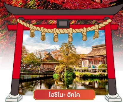
โอชิโนะ ฮักโค

เดินทางโดยสายการบิน : ไทยแอร์เอเชียเอ็กซ์