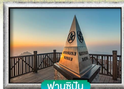
ฟานชีปัน