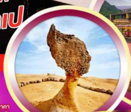
อุทยานแห่งชาติเย่หลิว