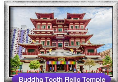
Buddha Tooth Relic Temple