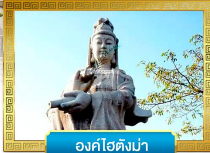
องค์ไฮตังม่า