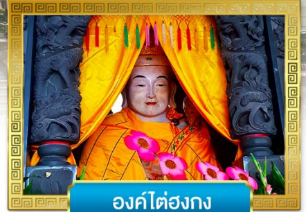
องค์ไต๋องกง