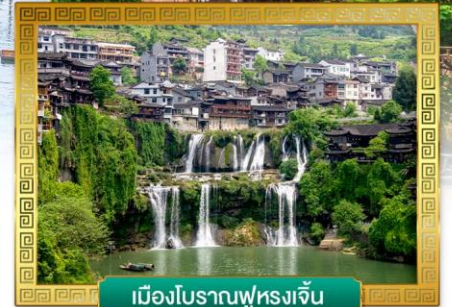
เมืองโบราณฟุหลงเจิ้น