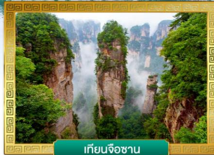
เทียนจื่อซาน

✔ ชมจุดเช็คอินใหม่!! ตึกมหัศจรรย์ 72 ชั้น