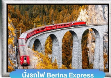
นั้งรถไฟ Berina Express