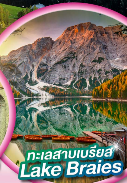
ทะเลสาบเบรียส Lake Braies