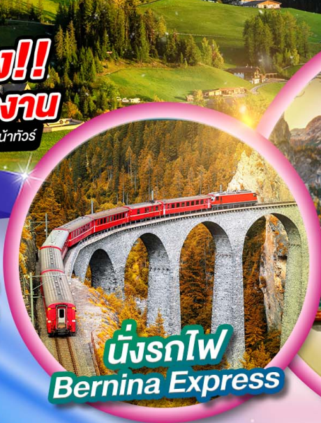
นั่งรถไฟ Bernina Express