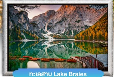
ทะเลสาบ Lake Braies