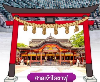
ศาลเจ้าไดซาฟุ