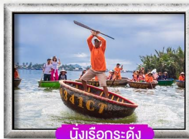
นั่งเรือกระด้าง