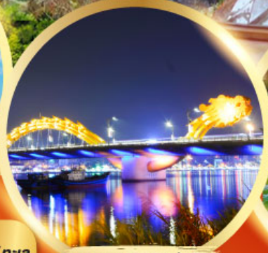
สะพานมังกรพันไฟ