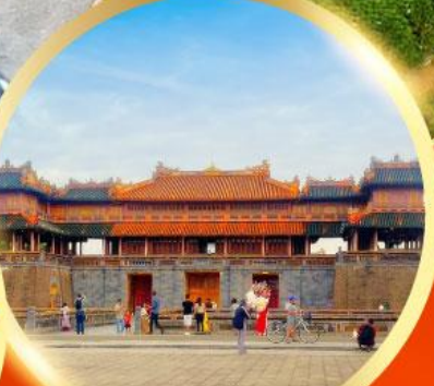
พระราชวังโบราณไดโนย