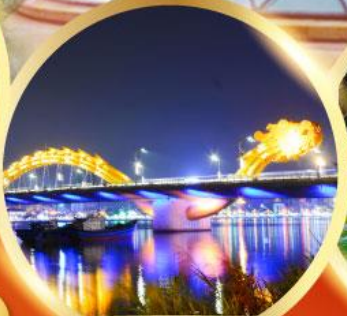
สะพานมังกรพันไฟ