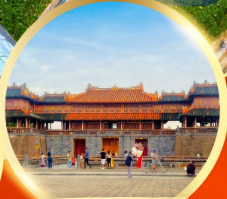
พระราชวังโบราณไคโนย