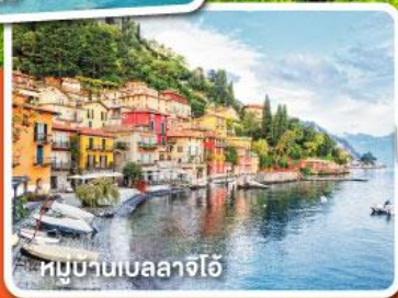
หมู่บ้านเบลลาจีโอ