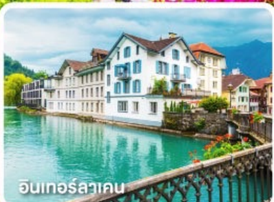
อินเทอร์ลาเคน