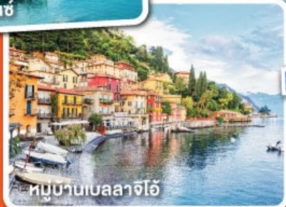
หมู่บ้านเบลลาจีโอ

เดินทาง 11-18, 18-25 พ.ค 67 08-15, 29 มิ.ย.-06 ก.ค. 67