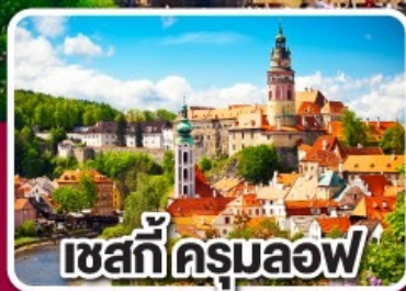
เซสกีครุมลอฟ

ฮังการี สโลวาเกีย ออสเตรีย เชก 7 วัน 4 คืน